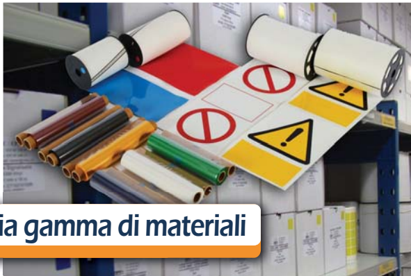
Ampia gamma di materiali